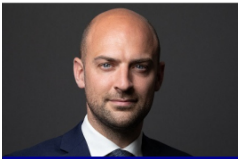
JEAN-NOËL BARROT Ministre délégué chargé de la Transition numérique et des Télécommunications

« L'écosystème de la French Tech est dynamique, divers et ambitieux. Mais surtout, il est présent partout : dans les grandes villes et les plus petites, en France et à l'international, à travers les entrepreneuses et entrepreneurs qui l'incarnent et les Capitales et Communautés French Tech qui les rassemblent. Grâce à ce réseau à la configuration inédite, des idées naissent et se développent jusqu'à devenir de vraies réussites entrepreneuriales.